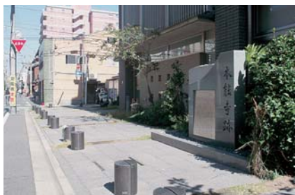
本能寺跡=京都市中京区

「信長」と評している。一方、こんな見方もある。歴史小説家、海音寺潮五郎は「(信長は)狂気の素質が相当あったんじゃないか。(中略)信長の弟の信行、信長の子どもは信忠、信勝、信孝、みんなアホです。信長の叔父たちも凡人です。その中で、信長一人だけがあんなふうになっただけか、これはいったい、これはやっぱり血統的に見て、一種の狂い咲きだと思えます」