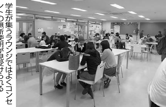
学生が集うラウンジでは多くコンセントの無断使用が見受けられる

2013年度4月から立命館大は一貫してキャンパス全面禁煙を推し進める。その傍らでキャンパス近隣の住宅や寺院などが密集する路上に、吸い殻を捨てる学生の姿が多く見られた。キャンパス内でも人通りの少ない場所でも隠れて喫煙をする学生もいた。悪質なケースでは、意図的に寺院の敷地に火種のついた吸い殻を投げ込むということもあった。 衣笠キャンパスの周辺には歴史的に重要な文化財である寺院が多くある。もし本学の学生の吸い殻が原因で火災が起るようなことがあれば、立命館大の社会的立場が危ぶまれることは必至だ。 学校法人として、これらの悪質な行為を防ぐために設置されたのが今回の管理エリアだ。エリアの設置には当然ながら費用が掛かる。その費用は大多数の喫煙習慣のない、また喫煙ルールを守っている学生らが学費として納めている共通の財産から出費されているという。また10月下旬から行われていた啓発キャンペーンにも学友会に所属する学生らを中心に多くの人が時間を割いて活動を行った。一部の悪質な行為のために、多くのお金や人員が使われていることを理解しなければならぬ。 これらのことを踏まえ、喫煙マナーを守らなければならないことは、もはや個人だけではなく大学全体を巻き込んだ問題として捉えざるを得ない。単なる迷惑という