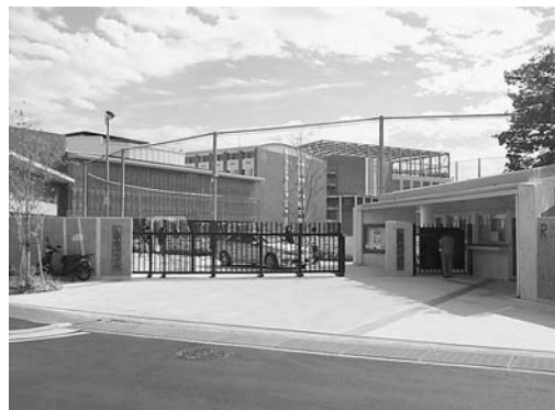
伏見区深草から移転した立命館中高 10月25日正午、長岡京市