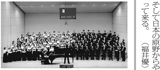
昨年の定期演奏会

ます。最後の第三部では混声合唱曲集「等圧線」を演奏いたします。この曲集には今年の10月に出場した関西合唱コンクールで金賞を受賞した曲も含まれております。学内のチケット販売も実施予定ですので、興味のある方はぜひお求めください。多くのお客様の来場を心よりお待ちしております。