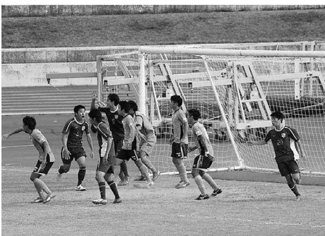
「疑惑のゴール」に対し審判に抗議する立命大の選手たち

4月以降の試合で勝ちななかった立命大は大産大戦で勝利。その後の試合でも随所に改善点が見られた。