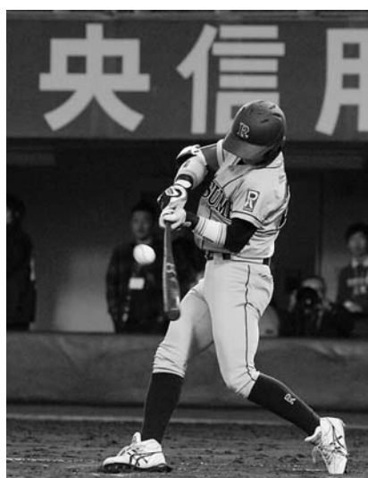
2回立命大八代が先制適時打を放つ

立命大と同大による「立同戦」第三戦が16日、わかさスタジアム京都(右京区)で行われた。立命大に