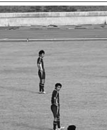
決勝点を挙げられ肩を落とす選手たち

この先の後期戦、残留争いから抜け出すために、もう一つ、進歩が必要だ。立命大は、今後16日に大教大と高槻市で、22日には最終節桃山大戦を西京極で戦う。(石塚大樹)