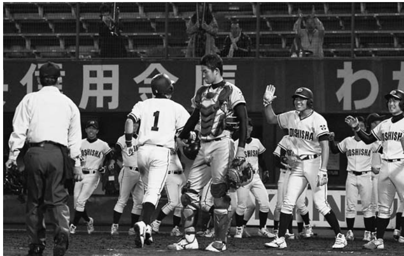
7回同大篠川に決勝勝ち越し2点本塁打を浴びる

立命大が同大との第三戦を2対3で落とし連覇を逃した。第一戦を1対4、第二戦を6対2で終え優勝まであと一歩だった。