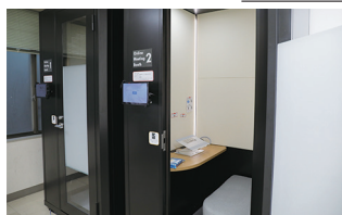
新設された オンライン選考用個室ブース

5月21日、大阪いばらきキャンパス(OIC)で「いばらき×立命館 DAY2023」が開催された。