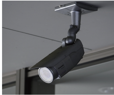
AI警備システム「アジラ」はキャンパス内の防犯カメラと連携する

本学は、AIやロボットを活用した警備システムを大阪に先駆けて導入した。OICに本格導入した。実装されたのは、株式会社アジラ（東京都町田市）が開発したAI警備システム「アジラ」とSECURITY株式（東京都中央区）が開発を手掛けた自律移動型警備ロボット「SQ-2」の2つ。本学の基本計画に基づく安全・安心に学べる環境整備の一環として、キャンパスのDX化が進められた格好だ。