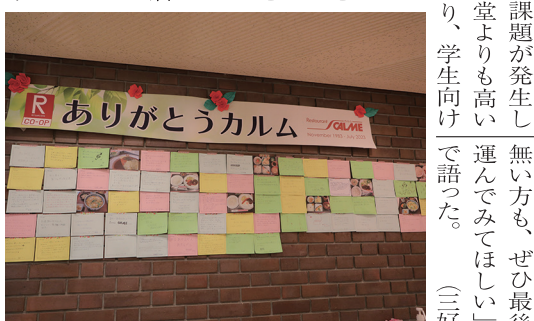
多数のコメントが寄せられているカルムありがとうプロジェクト

意見表明を行った総代には本学学生のみならず、本学院生や立命館アジア太平洋大学に所属する学生からも意見が寄せられた。本学学生からは、食堂の価格改定に対するポイントアップキャンペーンの提案や生協アプリの多言語対応を求める声が複数寄せられた。