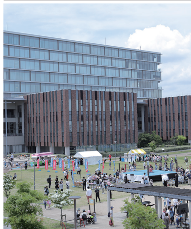
当日の来場者数は2万人以上になった(写真はOIC)

5月21日、大阪いばらきキャンパス(OIC)で「いばらき×立命館 DAY2023」が開催された。