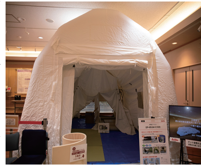
関連企業等による取り組みに関する展示の様子

1月1日に発生した令和6年能登半島地震は、日本全国で防災について考える契機となった。本学の研究機関の一つである歴史都市防災研究所(京都市北区)では、文化遺産や歴史都市を中心に災害に関する研究が進められている。地域や企業との連携ほか、国外の機関とも協働するなど、その活動は多岐にわたる。文化財の価値と人々の安全の二つを守ることで、全体的な研究テーマであるという。