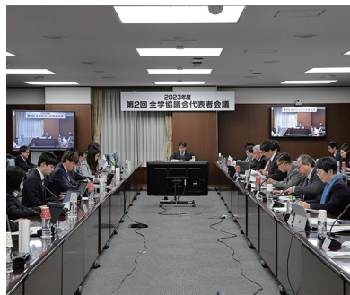
本会議は朱雀キャンパスにて行われた

「20歳未満の人は飲酒のリス クを勉強しなす必要があ る」と訴える。 葉石さんは、酒は少量で も健康にリスクがあり、脳 の発達に影響を及ぼすと紹 ほしい。」 （小林）