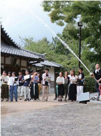
清水寺で行われている講義の様子

問題解決能力を育む「京都世界遺産PBL科目」は、特に参加学生から人気を集めており、本学は清水寺(京都市東山区)と協力した科目を二つ開講している。「京都の文化遺産とその保護」清水地域の防災への取り組み」は、清水寺周辺での合の対処について考える講義となっており。日本語を基準としない人々や観光客がいかに安全に避難できるかなど、地域住民以外のさ