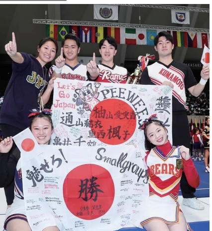
日本代表メンバーは全国から選出された

生2人を含む日本代表チームが優勝。26日のインカレでは自由演技競技 division1 スモールグループ演技競技男女混成部門にて本学学