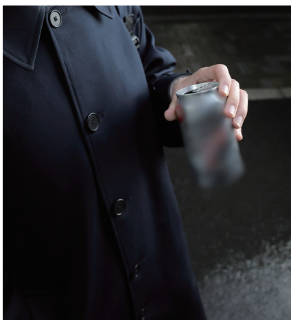
街頭で飲酒する本学学生の姿 (画像の一部を加工しています)

「20歳未満飲酒防止強調 月間」となる4月、全国各 所で20歳未満の飲酒防止を 目的として広報啓発活動が 行われる。しかし20歳未満 の飲酒が後を絶たない。 20歳未満の飲酒は法律で 禁止されており、警察によ る補導の対象だ。京都府警 少年課によると、昨年京都 府内で飲酒により補導され た大学生は811人上る。