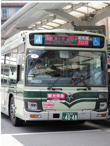
6月1日から運用が開始された 観光特急バス

京都市交通局は6月1日、運行する京都市バスにおいて、10年ぶりの大幅なダイヤ改正を実施した。同局は今回の改正に合わせて、バスを9両増車した。通勤・通学での利用が多い系統だけではなく、観光客向けの「観光特急バス」の新設など、オーバーリズム(観光公害)対策を意識した取り組みも行う。また同時に、バスの系統番号やその表示方法、停留所名の変更も実施し、停留所やバス系統の識別性向上を図る。 今回のダイヤ改正では、衣笠キャンパスへのアクセスに関わるものも多く、通学