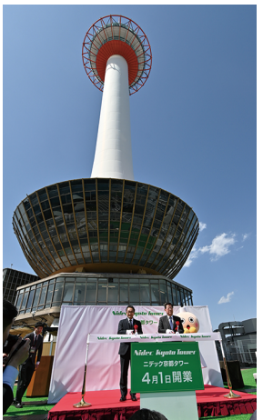
オープニングセレモニーの様子

ニデック(京都市南区)は3月19日、タワーを運営する京阪ホテルズ&リゾーツ(京都市下京区)から「ニデック京都タワー」に変更された。 JR京都駅烏丸口前に位置するニデック京都タワーは1964年12月に開業して以来、古都の玄関口を飾るランドマークとして親しまれており、京都市内で最も高いタワー。ニデックと京阪ホテルズ&リゾーツは 共に関東市内に本社を置く会社であり、「京都を盛り上げ、地元へ貢献していきたい」という双方の思いが一致したため、ネーミングライツの導入、契約が実現したという。 今後は、ニデック主催のイベントの開催も予定しているといい、京阪ホテルズ&リゾーツの担当者は「京阪グループとしても可能な限り協力し、地元や市民向けのイベントなどを通じて地元・京都を盛り上げ、さらに市民の方に愛されるタワーを目指していきたい」と展望を語った。 (吉江)