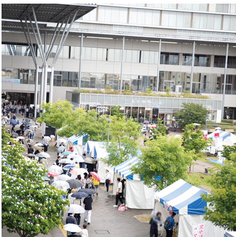
体験企画やキッチンカーが並びシンボルプロムナードには、傘をさし訪れた多くの来場者が見られた