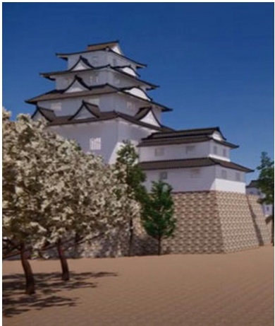
VRで復元された膳所城の天守