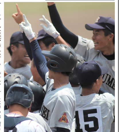
立命館宇治高校は4年ぶりの甲子園出場を果たした