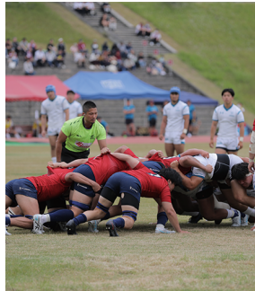
ラグビー戦では多くの学生が応援を楽しんだ

今年4月に開設30周年を迎えたびわこくさつキャンパス。その記念事業としてDays エナジースタジアム(草津市)にて本学ラグビー部・アメリカンフットボール部の試合を行う「Relive」が5月26日、6月9日に開催された。Reliveとは本年度から開始したホームゲームイベント。何度も思い出せる感動を創出すること、本学のスポーツチームを中心として大学スポーツの応援文化を学生に根付かせることを目標としている。5月26日には本学ラグビー部の試合が行われた。同日午前には本学ラグビー部が地元の小中学生にラグビーを教える立命館大学GENKIラグビーアカデミー