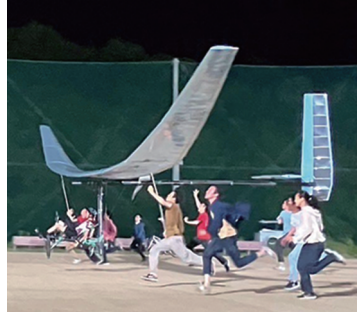
テストフライトの様子