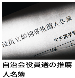
自治会役員選の推薦人名簿

昨年5月投票の自治会役員選を巡り浮上した、推薦人名簿の水増し疑惑。候補者自身に表計算ソフト「エクセル」で推薦人の氏名を入力させ「推薦署名」として扱うなど、不正を防げない選挙委の不備が露呈した。