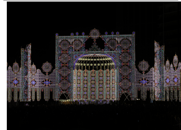
震災の鎮魂を未来へ

分野での取り組みを進めてきた。昨年1月には、宇宙航空研究開発機構(JAXA)が公募し、防衛省とも連携するとされている「宇宙戦略基金事業」において、月面探査・利用の開発や教育の拠点に採択された。新研究科の設置は「こうした研究基盤を一層発展させるため」と仲谷総長は説明した。 一方、宇宙分野などの先端研究は軍事目的で活用できるものが少なくない。政府は近年、先端研究を軍事目的で利用する流れを強めている。デュアルユース(軍民両用)の研究に対しては、日本学術会議が17年に研究の妥当性を「技術的・倫理的に審査する制度を(研究機関は)設けるべき」とする声明を採択するなど、内外で議論が続いている。 仲谷総長はデュアルユースについて「平和的・民生的な利用に限定する倫理ガバナンスを徹底する。知を通じて平和を創造し続ける」として、軍事研究は行わない姿勢を示した。(星野)